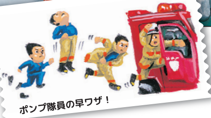
ポンプ隊員の早ワザ!